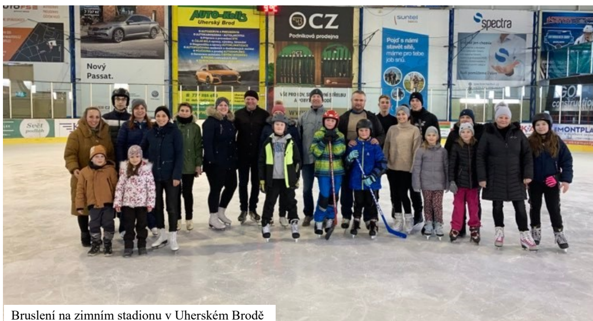
Bruslení na zimním stadionu v Uherském Brodě