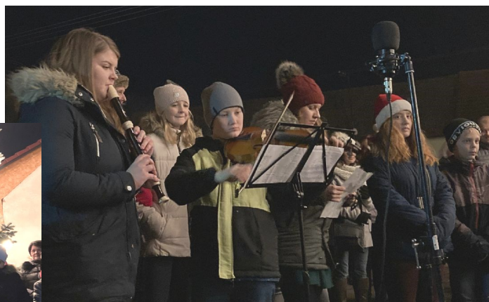
Rozsvěcování vánočního stromku