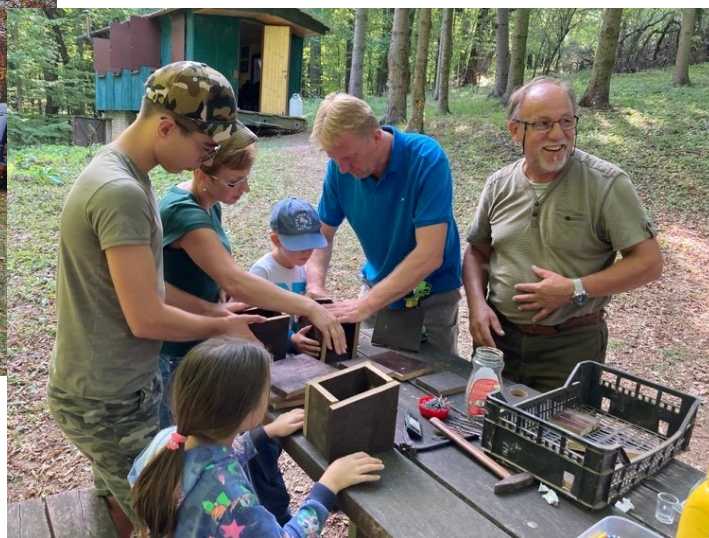
Výšlap s myslivci