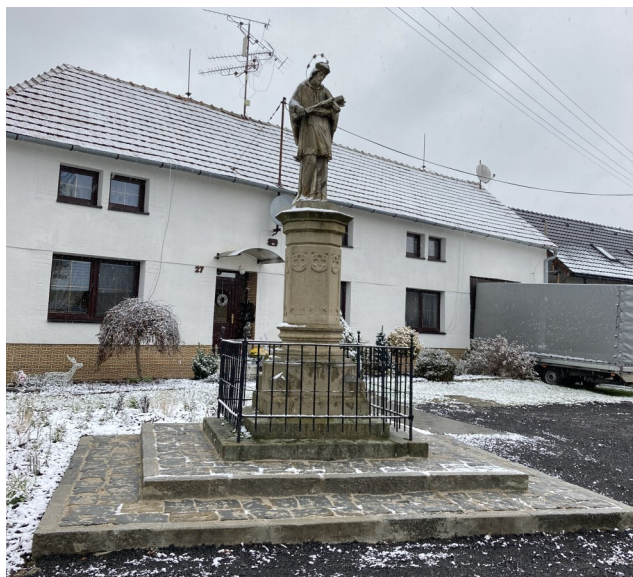
Foto nahoře: Socha sv. Jana Nepomuckého Foto dole: Autobusová zastávka