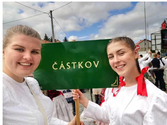
Slavnosti vína v Uherském Hradišti

Den maminek jsme oslavili jednu květnovou neděli společně s dětmi z Částkova a folklorním souborem Malá Holomňa, který k nám přijel z Pašovic. K tanci a poslechu hrála živá hudba.