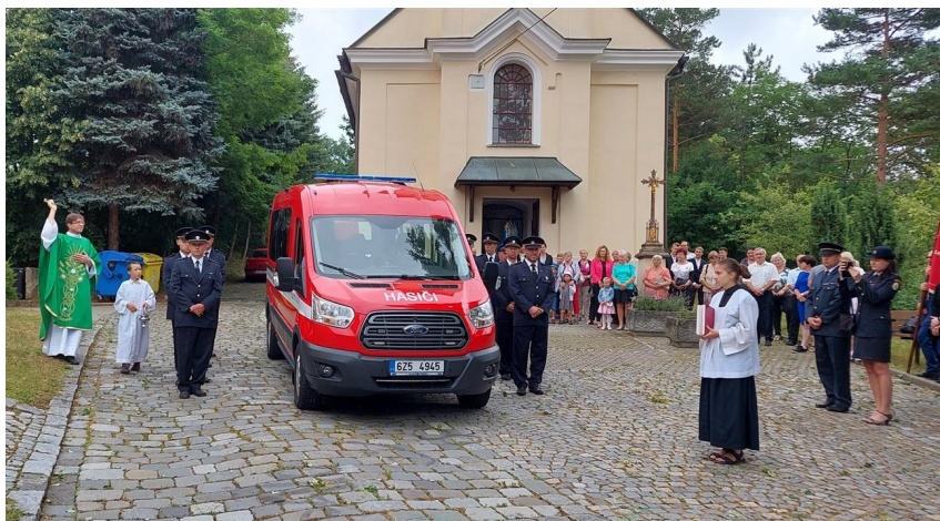
Svěcení nového zásahového vozu