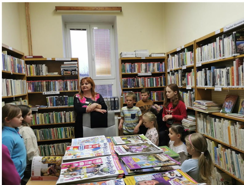
Noc s Andersenem