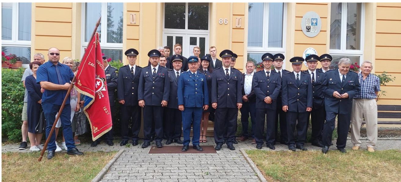
Oslavy 90. výročí založení SDH Částkov