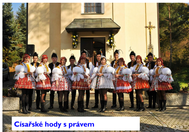
Císařské hody s právem