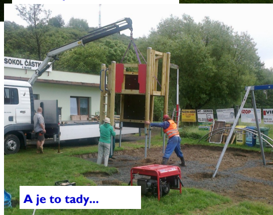
A je to tady...