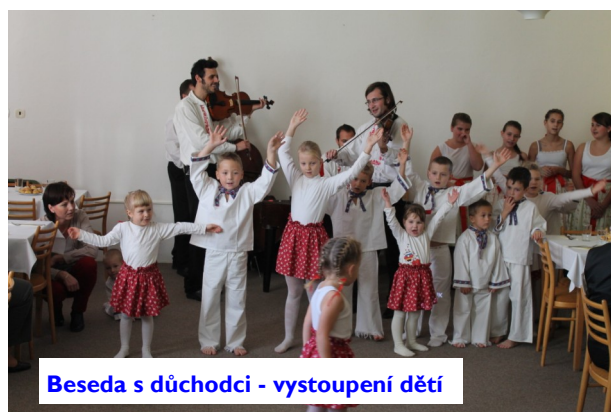
Beseda s důchodci - vystoupení dětí