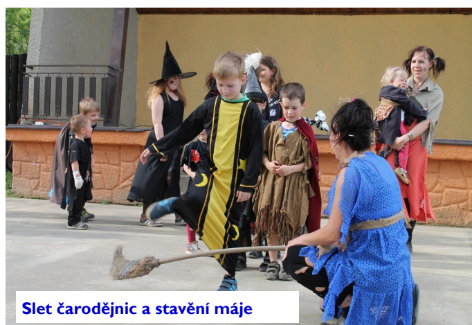
Slet čarodějnic a stavění máje

Výlet do aquaparku je pro děti velkou výzvou, které se těžko odolává : )