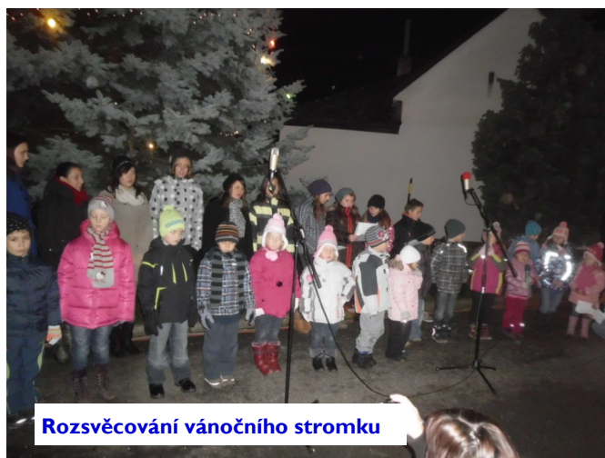
Rozsvěcování vánočního stromku

Rozsvícení vánočního stromu oživily děti svým koledováním mezi hudebním vystoupením cimbálové muziky. Společně vánočně naladili první adventní odpoledne.