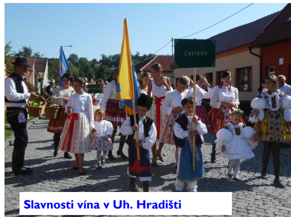
Slavnosti vína v Uh. Hradišti