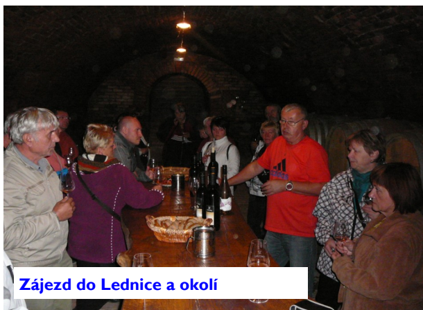
Zájezd do Lednice a okolí