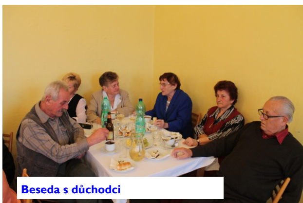
Beseda s důchodci