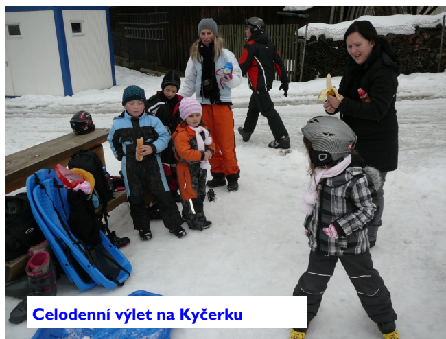
Celodenní výlet na Kyčerku

Celodenní výlet na Kyčerku byl po Vánocích skvělým pohybovým relaxem.