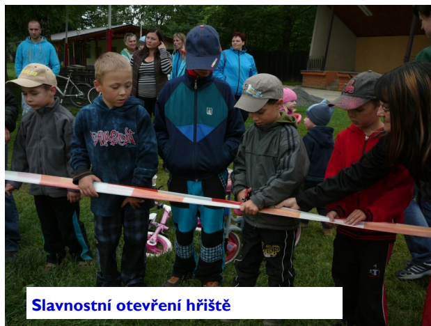
Slavnostní otevření hřiště