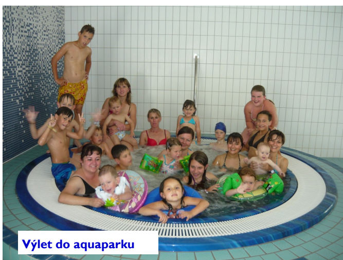
Výlet do aquaparku

Noc s Andersenem se pořádala podruhé. Děti se sešlo spousta, aby si poslechly pohádku, zahrály divadlo nebo něco namalovaly. Ty odvažnější se rozhodly přenocovat na obecním úřadě, takže pohádkovou noc zakončily snídaní.