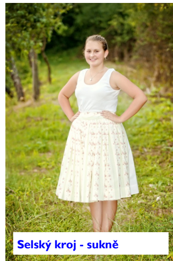
Selský kroj - sukně