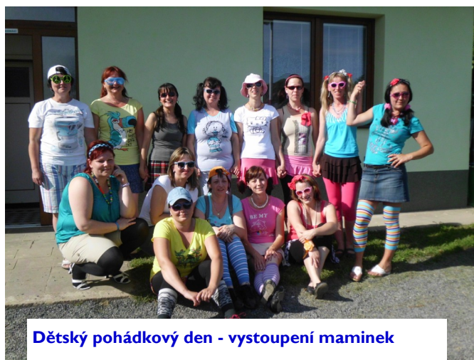
Dětský pohádkový den - vystoupení maminek