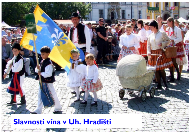
Slavnosti vína v Uh. Hradišti