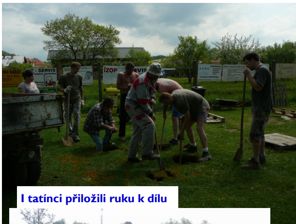
I tatínčí přiložili ruku k dílu