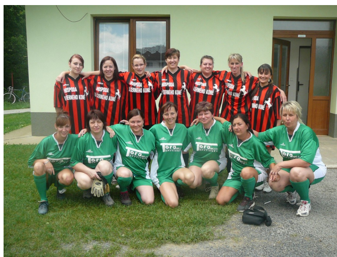
Netradiční hráčské týmy na Pouličním turnaji