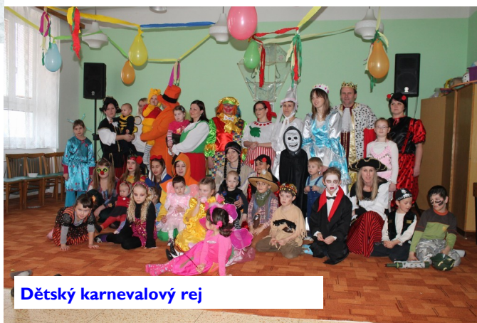
Dětský karnevalový rej

Pro velké byl fašank, pro malé následoval dětský karneval , do kterého se v maskách zapojily i maminky. Hudba, tanec a soutěže pobavily všechny přítomné.