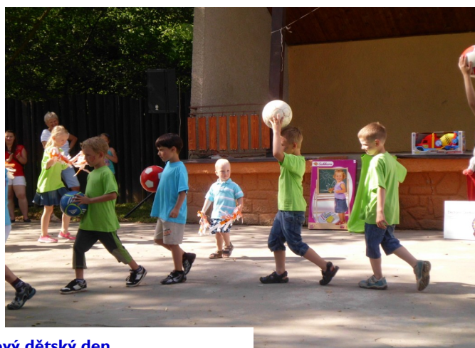
Pohádkový dětský den